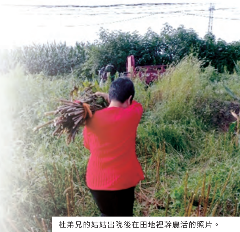
杜弟兄的姑姑出院後在田地裡幹農活的照片。