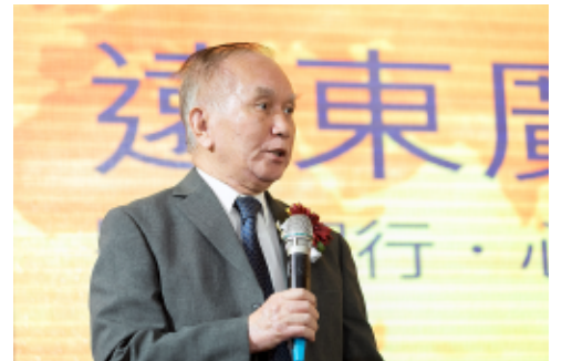
● 盧家駁牧師帶領會眾為內地教會面對的困境代禱。